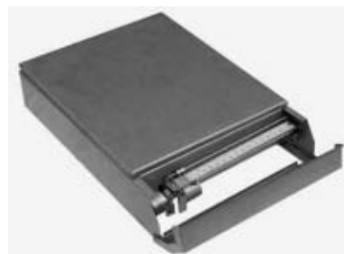
Pčelarska vaga - najznačajniji pokazatelj pašnih prilika