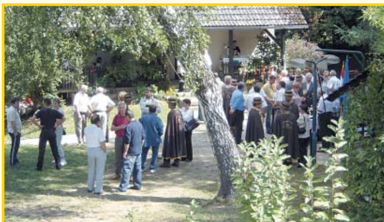
Druženje pčelara u Jagnjedovcu

Ispred kapelice sv. Ambrozija održana je sveta misa, a nakon nje je dr. vet. med i profe-