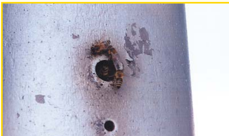
Pčele u semaforu

mnogobrojni automobil koji prolaze, uopće ih ne zanimaju. Još je manje jasno kako na temperaturi od 35 – 40°C izgleda saće u metalnoj cijevi. Neobičan spoj prirode i tehnologije pratit ćemo i dalje te vidjeti što će se događati