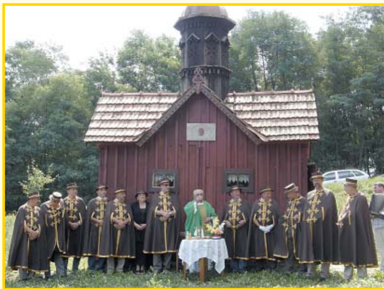
182 Sveta misa ispred kapelice sv. Ambrozija na imanju obitelji Bartolec

Da pčelarima ne bi bilo sve tako crno, pobrinuli su se ljubazni domaćini osiguravši dovoljno ića i pića svim sudionicima skupa, pa nije bilo teško ostati do kasnog poslijepodneva prepričavajući mnoge pčelarske događaje.