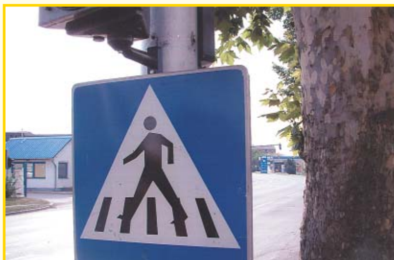
Semafor u kojem pčele imaju dom

Da naše pčelice znaju pronaći čudna mjesta za svoj dom to svi znamo, ali da im jedan semafor godinama služi kao topli dom, više je nego začuđujuće. U Vukovarskoj ulici u Osijeku smjestile su se u metalnu cijev promjera 150-160 cm. Naši mali farmaceuti lete na zeleno i na crveno svjetlo. Dosta Osječana zna za njih još od Domovinskog rata. Ta čudna košnica ima još čudnije leto. Na tri rupice promjera 16 mm prenose se pelud i nektar, a