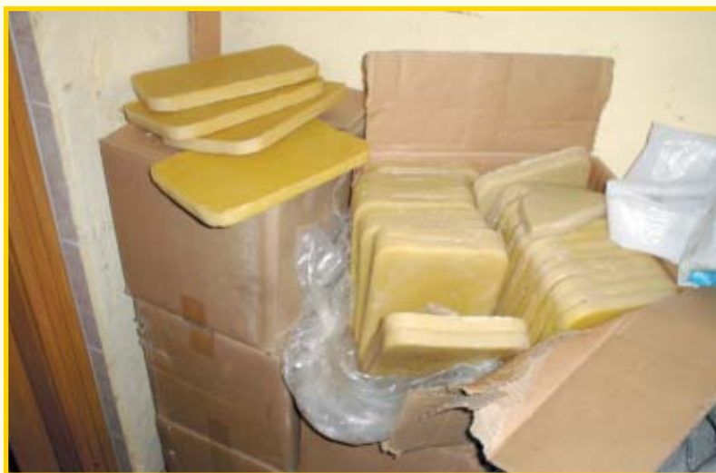
Vosak u pločama uvezen iz Kine

zaključiti da taj vosak nije domaće proizvodnje, što mi je potvrdila i osoba koja je snimila fotografije i rekla da je taj vosak uvezen iz Kine.