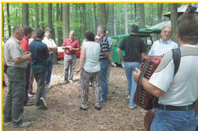
Veseli pčelari

rišteno u turističkoj promidžbi Virovitice i okolnog područja”, istaknuo je Branko Tomšić, predsjednik Udruge pčelara ”Virovitica”. Stoga su razumljivi zahtjevi pčelara da njihov med od lipe što prije dobije certifikat o zemljopisnom podrijetlu.