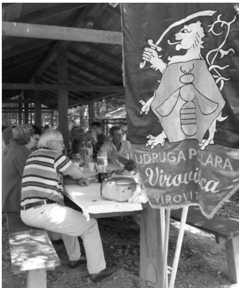
Okupljeno mnoštvo na Danima lipe u Virovitici

”Posve je jasno što Udruga pčelara „Virovitica“ drži do tradicije Dana lipe, jer je virovitičko područje najbogatije lipom u Europi, a na njemu se ostvaruje i oko 50 posto cjelokupnog hrvatskog pčelarstva, što nije dovoljno isko-