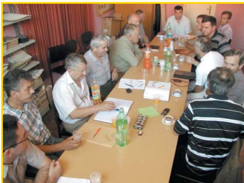
Izvanredna sjednica Upravnog odbora HPS-a

Sabor da je izmanipuliran od onih kojima takav način poticaja odgovara.