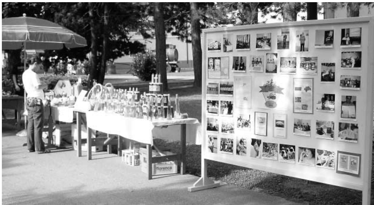
Najveći pčelarski štand dosadašnjih Lovrenčeva snimljen rano ujutro.