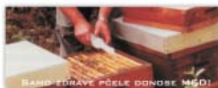
RANO EDRAVE PČELE DONOSE MGD!