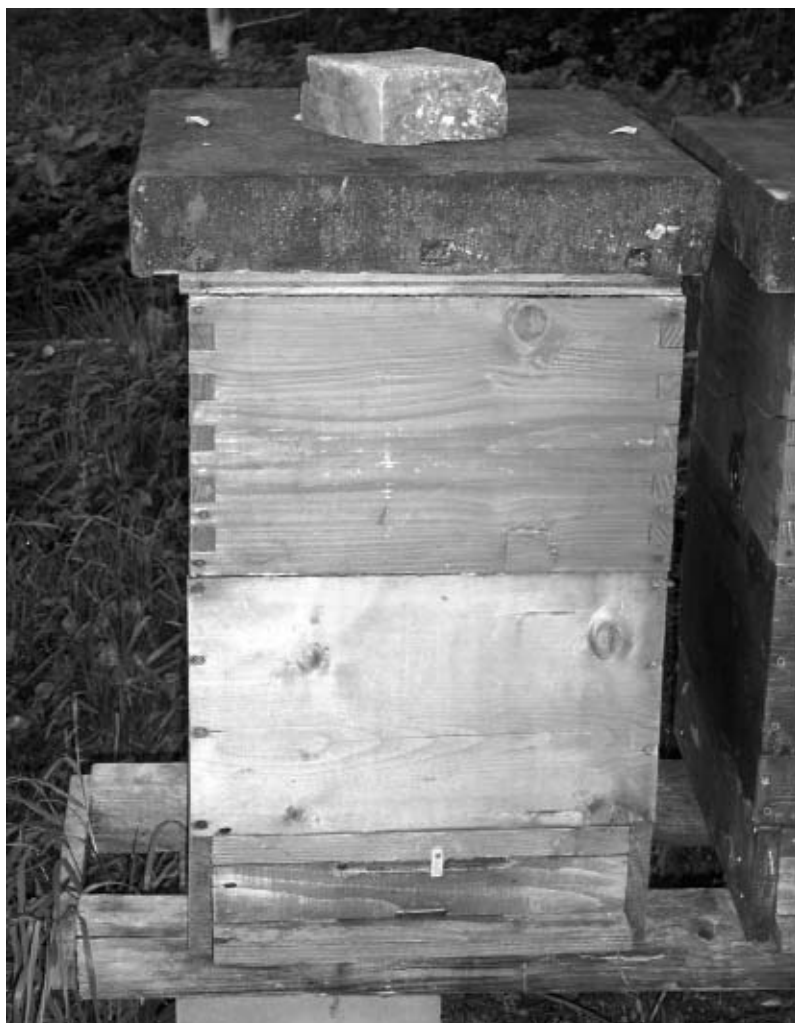
Cigla na krovu košnice spriječit će da ga jaki zimski vjetrovi dignu

čiste i ispaljene nastavke u stup od 7-8 komada. Na dno i na vrh stupa stavljamo guste mrežice, koje sprečavaju ulazak voskova moljca i nećemo ih dirati do upotrebe u proljeće.