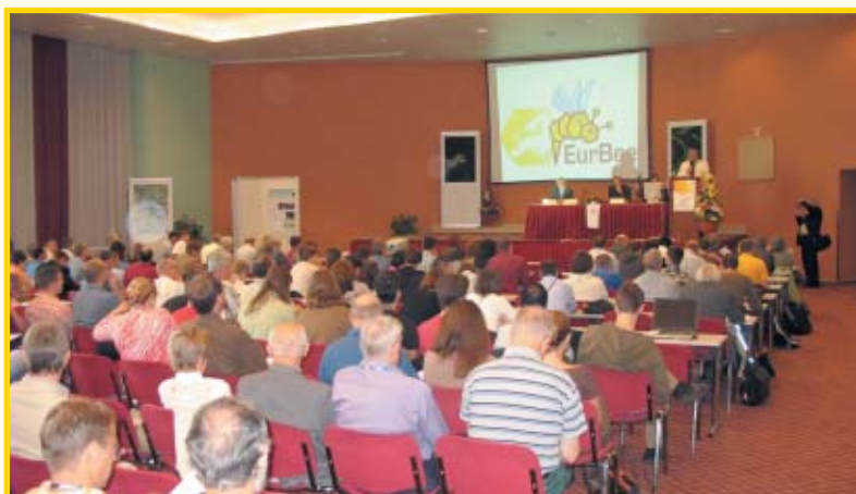
Radna atmosfera na konferenciji.

Zanimljiv je bio i podatak da su tijekom istraživanja na određenoj lokaciji sparivališta trutova i matice pronašli trutove iz 240 pčelinjih zajednica kod europske medonosne pčele. Istodobno, kod azijske pčele Apis dorsata na sparivalištu su nađeni trutovi iz 59 zajednica. Također valja istaknuti da postoje znakovite razlike u vremenu svadbenog leta pojedinih vrsta. Primjerice, kod naših europskih pasmina