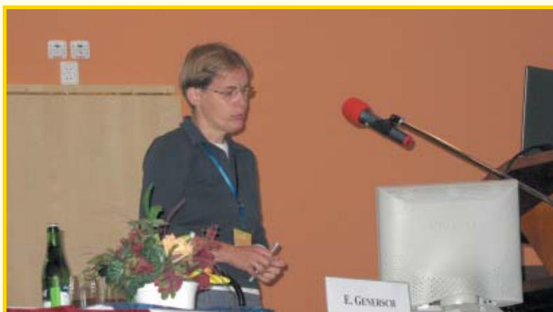
Dr. Elke Genersch

badema otprilike 90%, jabuka oko 80%, trešnji 60%, a citrusa oko 30%. Urod kave i kakaa bi se smanjio za 50%, a vanilije za gotovo 100%. Vrijednost i značenje oprašivanja u engleskim plastenicima za rajčicu i slatku papriku iznosi oko 45 milijuna eura, a za ostale ratarske kulture oko 250 milijuna eura na godinu. Podsjetio nas je da je vrijednost jedne pčelinje zajednice u Velikoj Britaniji oko 1200 eura (med, vosak i oprašivanje) te je citirao Krella koji je 1998. utvrdio da globalni učinak oprašivanja na svjetskoj razini iznosi više od 100 milijardi eura. Stoga nas je i ohrabrila spoznaja da je u tijeku istraživanje pod nazivom Alarm projekt, u koji je uključeno 56 suradnika iz 26 zemalja. Vrijednost projekta je oko 16,7 milijuna eura, a glavna pitanja usmjerena su na gubitak oprašivača, klimatske promjene, utjecaj kemikalija iz okoliša te prisutnost novih vrsta koje ugrožavaju postojeće oprašivače. Oni koji žele doznati više o Alarm projektu, mogu posjetiti stranice www.alarmproject.net .