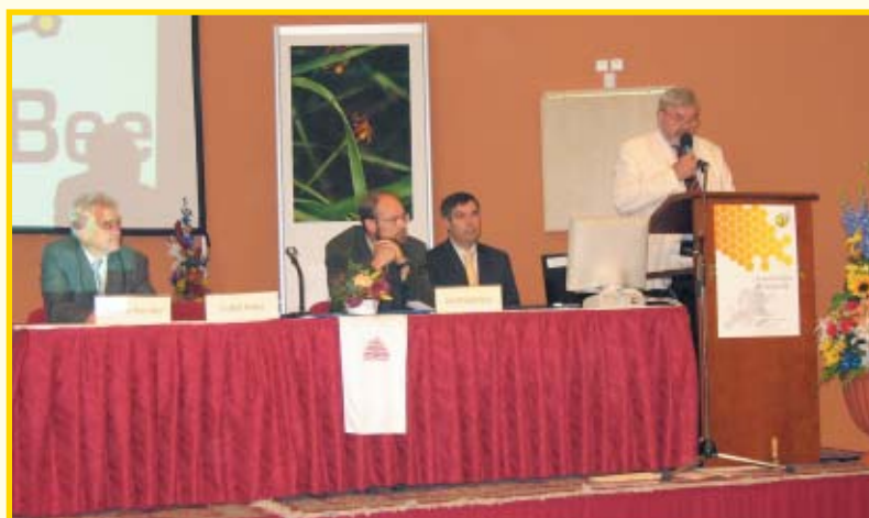
Predstavnici Češkog pčelarstva

ta bili citirani u uglednim pčelarskim časopisima i knjigama. Njihova prezentacija u Pragu pod naslovom “Biologija reprodukcije pčele (rod Apis) – raznolikosti i prilagodba“ na zanimljiv je način upozorila na potrebu daljnjih istraživanja komparativnih razlika između pojedinih pčelinjih vrsta koje pripadaju rodu Apis. Istraživane komparativne razlike bile su: produktivnost matice i trutova, njihovo spolno dozrijevanje i omjer u pčelinjoj zajednici, sparivanje te prijenos i pohrana spermija u sjemenskoj vrećici. Primjerice, pčele koje pripadaju vrsti Apis koschevnikovi u zajednici bez matice prihvatit će mlade ličinke vrste Apis cerane i uspješno odgojiti maticu za svoju zajednicu koja nosi genetsku osnovu A. cerane. U većini vrsta matice je veća od radilica. Međutim, u vrste Apis dorsata ta je razlika veoma malena, dok u pčela vrste Apis Florea matice je gotovo dvostruko teža od radilice. Istraživane su i raz-