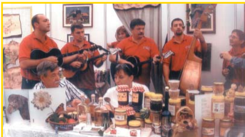
Za atmosferu pobrinula se tamburaška skupina "Ej tamburo".

la i prodajna, no nismo se mogli pohvaliti većom prodajom. Na našem je štandu uvijek bilo veselo, a za to se pobrinula tamburaška skupina „Ej tamburo“, koja nije zabavljala samo nas, nego i posjetitelje, koji bi zastali malo duže kod nas, a mnogi su i zapjevali.