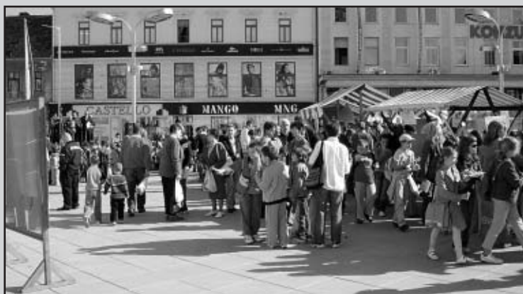
Mnoštvo djece na manifestaciji "Mladi i med"

Cijeli događaj upotpunila je izložba dječjih likovnih radova i čitanje nagrađenih literarnih radova o temi pčelarstva uz prigodan glazbeno – scenski program.