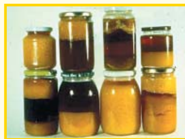
Pogreške u pakiranju meda

Brzina kristalizacije utječe na veličinu kristala. Što je proces kristalizacije sporiji, to su kristali veći. Kristalizacijom se oslobađa voda. Nezreo i vodenast med često se kristalizira nehomogeno i javlja se izdvajanje i sedimentacija kristaliziranih dijelova. U tekućoj fazi povećava se rizik od fermentacije, što također utječe na trajnost. Kontrolirana kristalizacija, npr. pri proizvodnji kremastog meda, iz tog se razloga mora provesti u cijelosti.