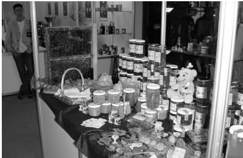
Pčelarska izložba na Pampasu.

Svečano otvorenje bilo je u hotelu Waldingeru, gdje je nazočne kratkim govorom pozdravio pomoćnik ministra poljoprivrede, šumarstva i vodnoga gospodarstva gosp. Srećko Selanec, koji je na taj način otvorio pčelarski skup. Da bi otvorenje bilo što svečanije, pobrinulo se osoblje hotela, koje je u suradnji s vrsnim kuharima priredilo obilje delicija spravljanih od meda ili s njegovim dodatkom te je sve bilo aranžirano u tonovima šarenih jesenskih boja.