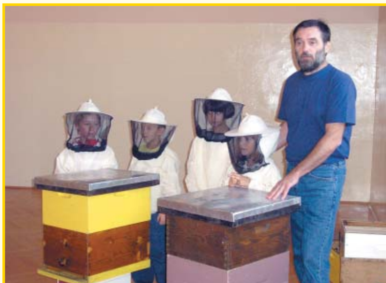
Predavač i njegovi mali pomoćnici.

med. Pokazao im je kako pčelinja kućica izgleda i od čega se sastoji. Pokazao im je ali i, uz pomoć svojih brojnih pomoćnika, omogućio da opi-paju i pomiriše satnu osnovu, okvire s izgrađenim saćem i one napunjene medom. Pokazao im je također kako pčelar radi na pčelinjaku, pri