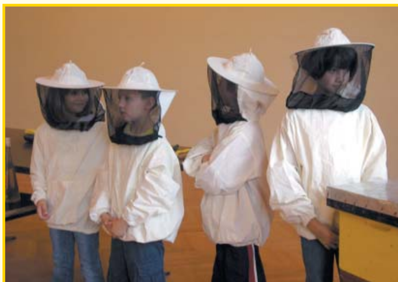
Mali pomoćnici u pčelarskim košuljama bili su atrakcija za svoje vršnjake.

čemu su mali pomoćnici – pčelari imali odgovoran posao dimljenja pčela. Djeca su vidjela kako izgleda zreo med i organiziran rad u vrcaoni. Sama su se okušala u otklapanju meda, a počast da vrte vrcalicu i prvi kušaju tek izvr-cani med imali su mali pomoćnici – pčelari. Na ma-