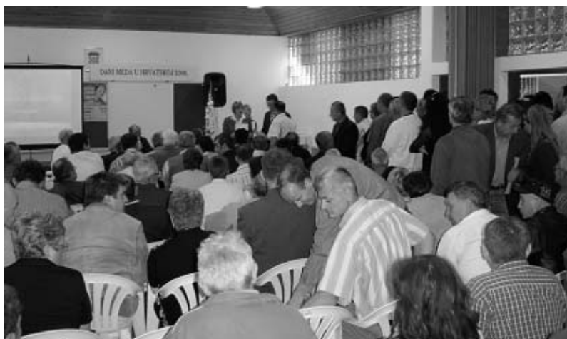
Dodjela odličja nagrađenim pčelarima.

iznio nekoliko nevjerojatnih podataka do kojih je došao analizom upitnika o uginuću pčelinjih zajednica, a koji je izradio u suradnji s HPS-om. Detaljniju analizu podataka najavio je za pčelarski sajam Gudovec – 2007.