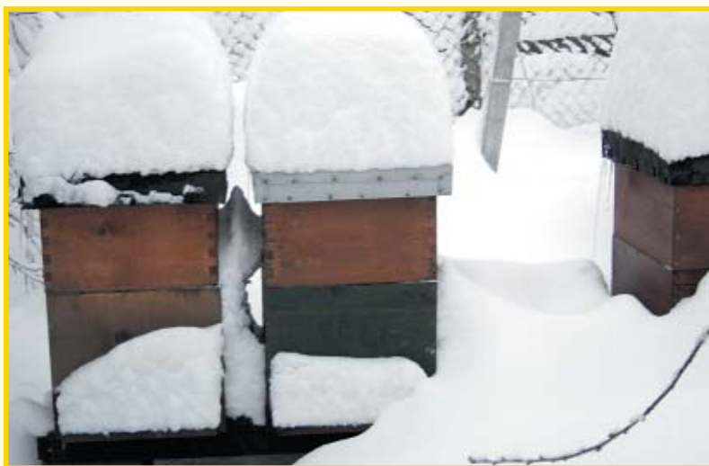
Snijeg sa košnica nije potrebno čistiti, ali bi ga sa leta povremeno trebalo skinuti kako bi pčele imale zraka.

Potrebno je da spremimo sav materijal i alat u zatvoreno kako po njima ne bi hodale pčele, jer moramo imati na umu da po tome alatu i materijalu ne šecu samo naše, nego i tuđe pčele o kojima ništa ne znamo.